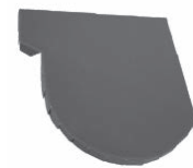
Chiusura testata grondaia